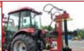
T433 mit Holzspalter

KLARMANN-LEMBACH ☎ 09522 9220-0 97483 Eitmann