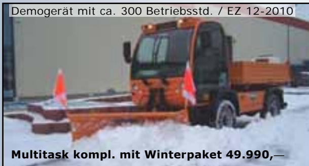
Demogerät mit ca. 300 Betriebsstd. / EZ 12-2010