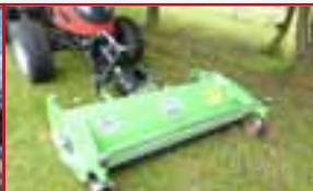
T353 mit Mulchmäher