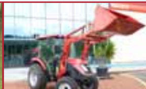
T433 mit Frontlader