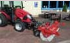
T273 mit Kehrmaschine

Kaufen Sie einen TYM Traktor mit passendem Zubehör sparen Sie 1.000,— €