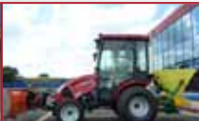
T273 mit Winterpaket