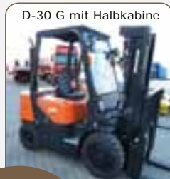
D-30 G mit Halbkabine

Halbkabine = Dach mit Scheibe für bessere Sicht nach oben sowie Frontscheibe mit Scheibenwischer und Scheibenwaschanlage.